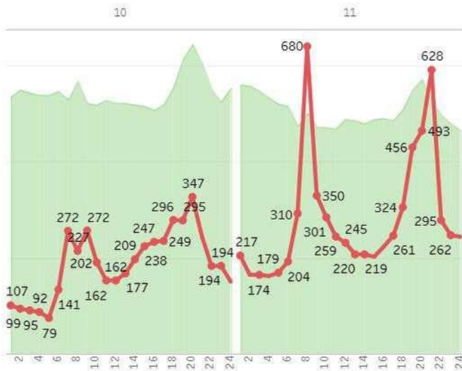
Динаміка ціни бази (Євро/МВт*год)