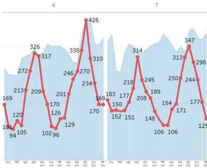
Динаміка ціни бази (Євро/МВт*год)